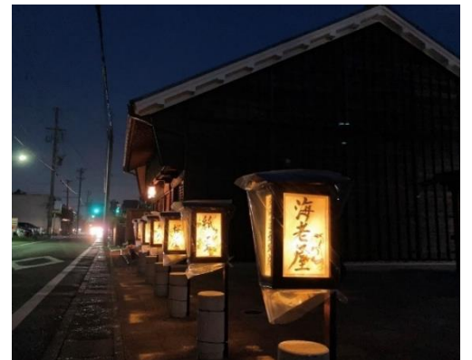
東海道赤坂宿 行灯(あんどん)のあかり