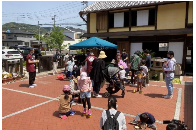
はたご de あそぼう！ （竹ぽっくり作り体験）

参加者 竹ぽっくり作り体験 20人 いけばな体験参加者 18人 甲冑を着て写真撮影 12人