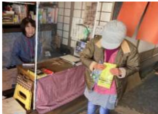
クイズラリー記念品贈呈