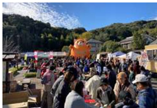
赤坂宿もみじ祭り+ 赤坂町内会歩けあるけ大会