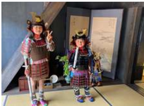
甲冑を着て記念撮影