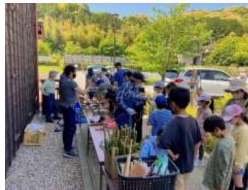
竹ぼっくり・水鉄砲作り体験