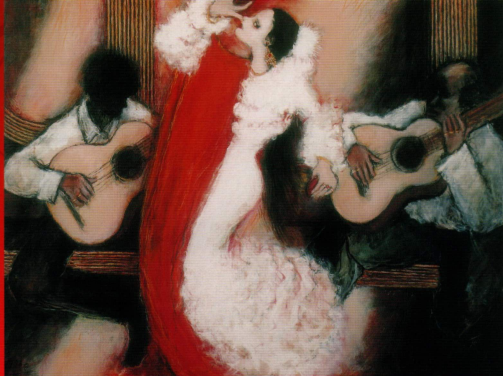
畑 遼『マドリッドの夜』