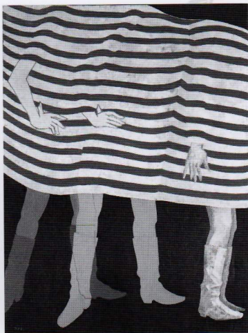
中島 良【平均的女性ii】

容姿の美しさだけでなく、しぐさや情緒豊かな内面に魅力が詰まった女性たちの姿。多くの作家が、魅了され様々な芸術ジャンルにおいて女性の美は表現されてきました。 本展では、当館が収蔵する作品の中から、女性を描いた作品や彫刻をご紹介します。