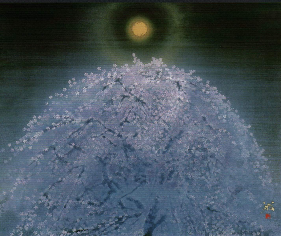
松村 公嗣『おぼろ月』