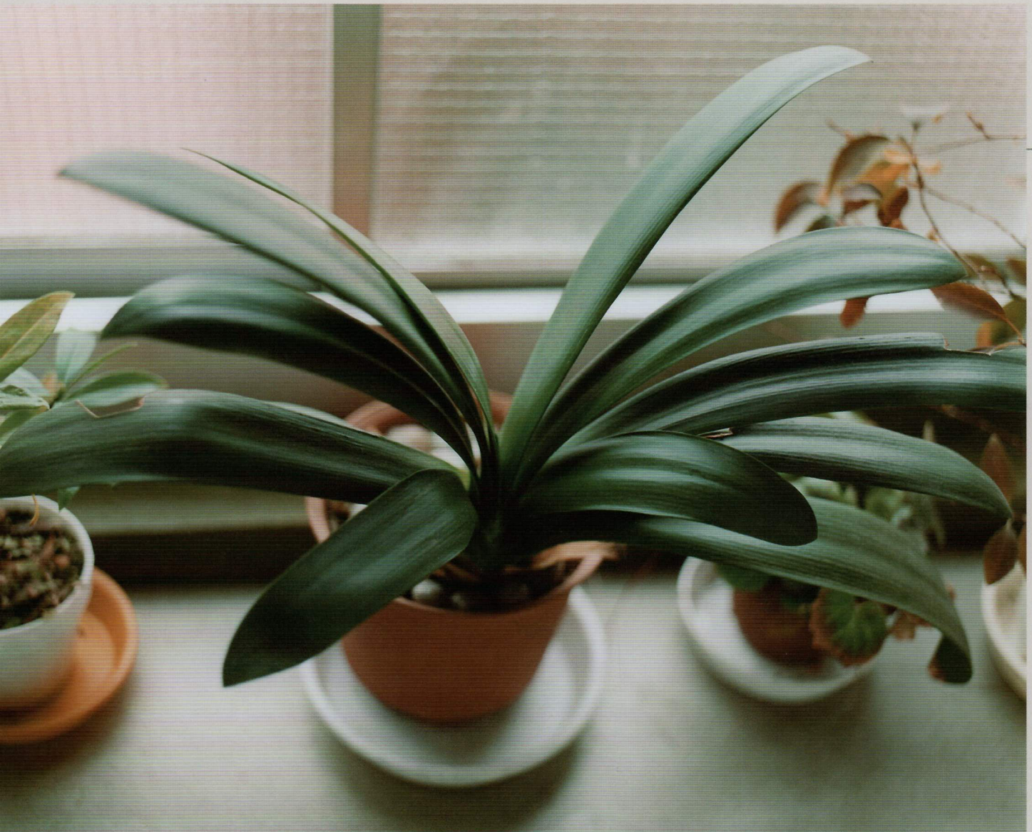
〈写真集「生きている」より〉 佐内正史