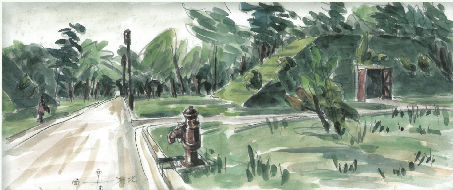
火薬庫-海軍工廠北門近く-竹生節男 画