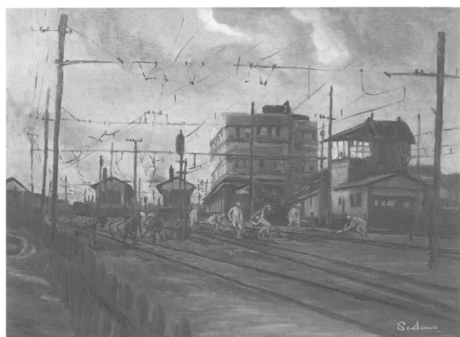
工廠被爆翌朝 省線豊川駅／竹生節男 画