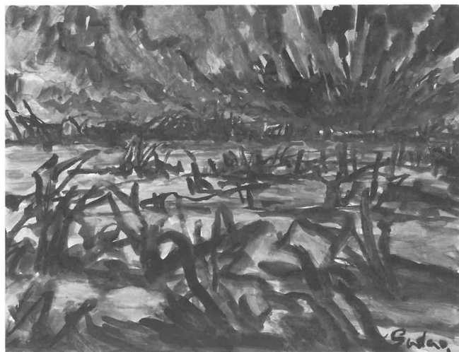
一九四五年八月七日午後／竹生節男 画