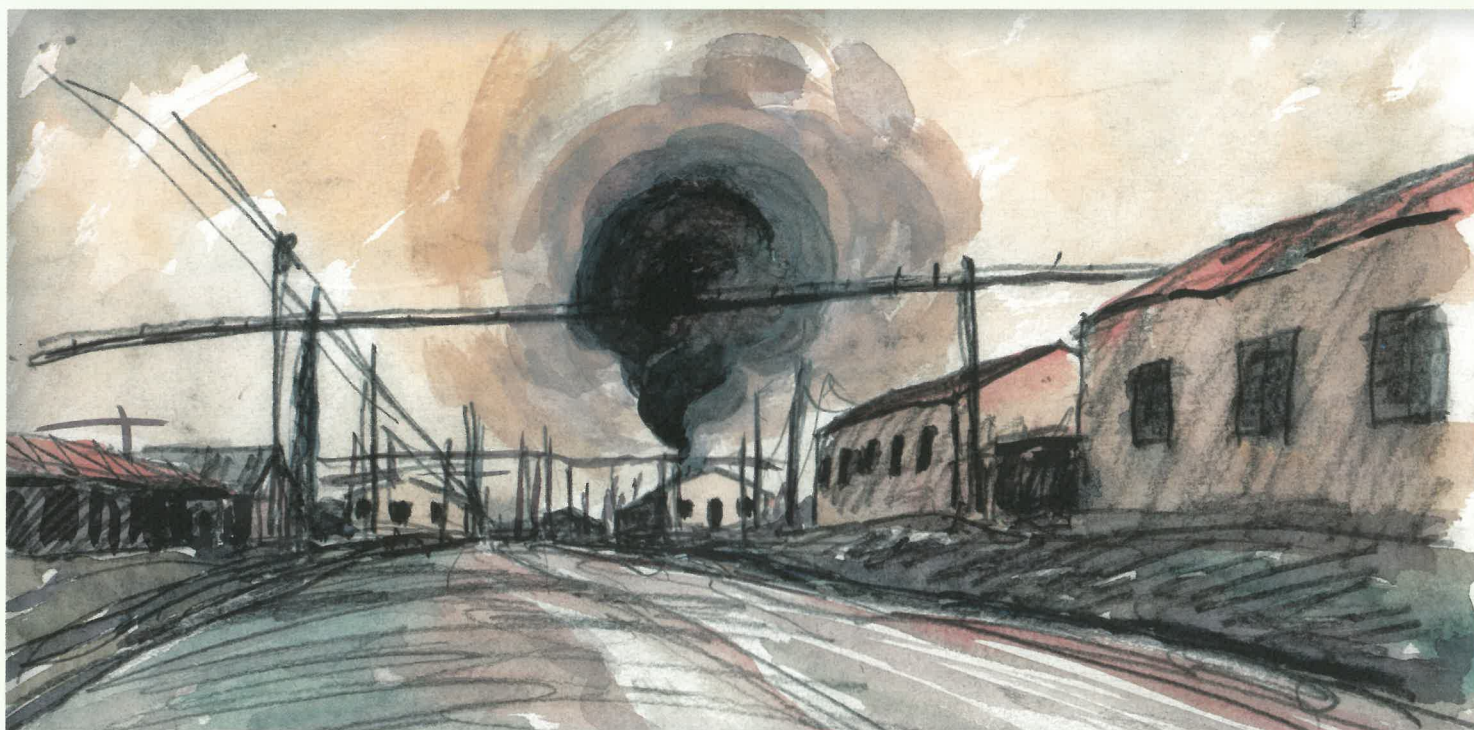
(火薬装填工場の爆発事故の様子) / 竹生節男 画