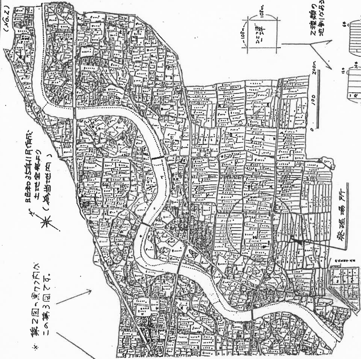
本3図 為当地内の条里制遺構、長型型の地割であることとわかる