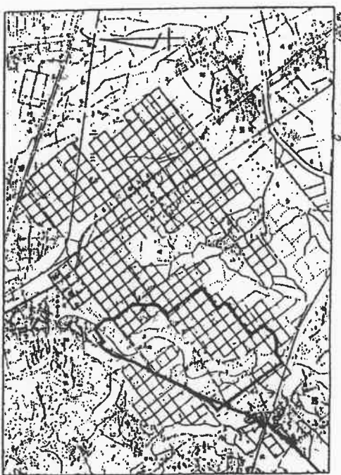
本2図 豊川市および御津町の条里制遺構の分布 ・この方面の1マスは一坪(約108m×108m) ・条里の方向が旧国道1号線に沿ってある。