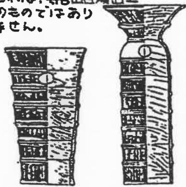
左・円筒埴輪 右・朝顔型円筒埴輪