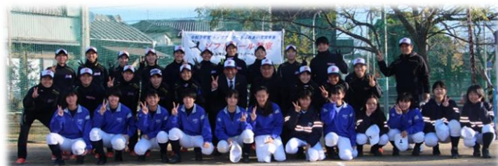
ソフトボール教室