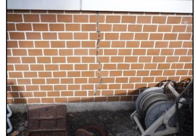
壁タイルクラック