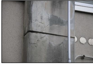
柱コンクリート膨れ