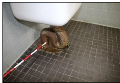
衛生器具下金物腐食