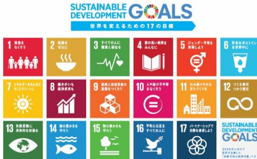
多様化する社会への対応