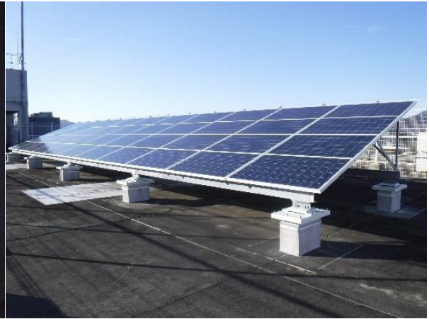
資源の有効利用への対策が不十分な数の太陽光パネル