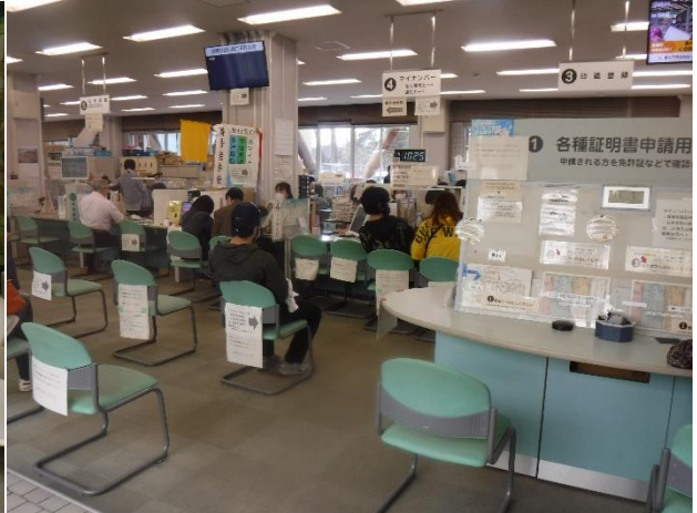
不足する受付窓口