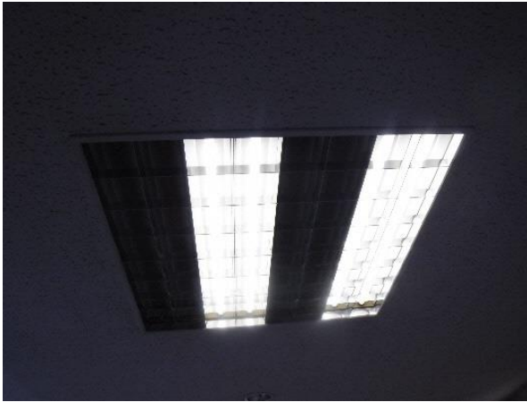
省エネのため蛍光管が外された照明器具