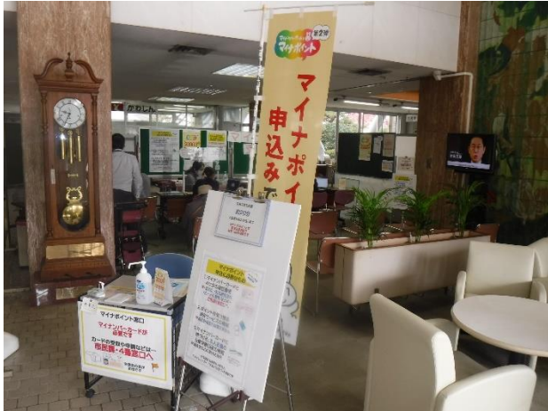
不足する多目的利用スペース