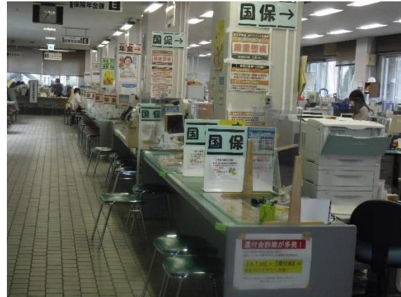
分散する受付窓口

・豊川市公共施設適正配置計画では、「センター機能として本庁舎への機能集約の程度、支所機能として必要なサービス内容、効率的な執務レイアウトと合わせて適正な施設規模を検討し、庁舎機能を集約、センター機能の拡充を図ります。」という方向性を示しています。