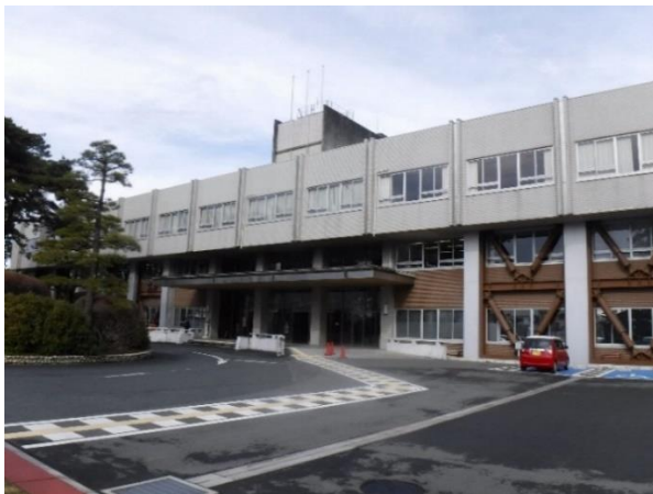
豊川市役所本庁舎 外観

以上を踏まえ、財源も含めた組織的な検討の必要性から、財産管理課、企画政策課、財政課による「本庁舎あり方検討会」を組織し、今後の本庁舎のあり方について検討を行いました。