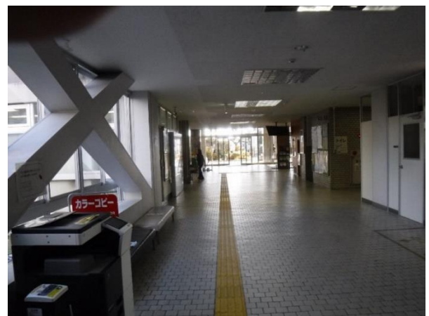
豊川市役所本庁舎 内観