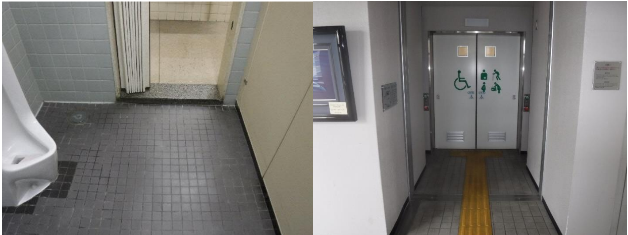
段差の解消が出来ていないトイレ出入口