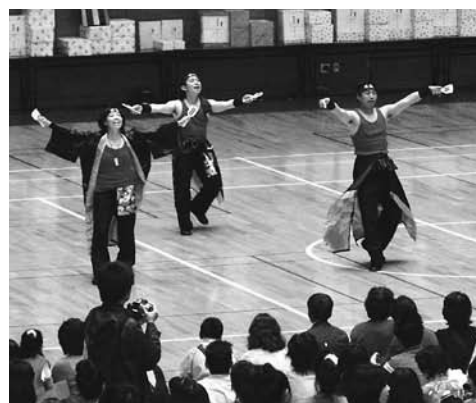
昨年のコンテストの様子