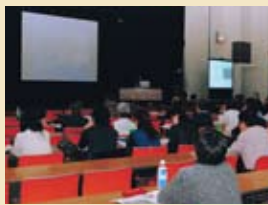
旧豊川海軍工廠近代遺跡調査報告会

B級ご当地グルメの祭典「B-1グランプリ in HOMEJ」にいなり寿司で豊川市を盛りあげ隊が出展(13日まで)