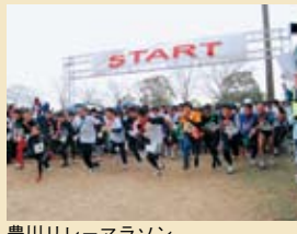
豊川リレーマラソン