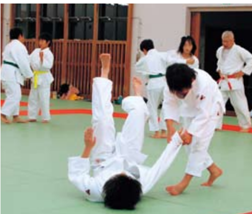
同時に受け付け。受講料を添えて武道館へ

日時 1月4日から3月7日までの毎週水曜日で全10回。午後6時30分から8時まで 会場 武道館 対象 市内の小・中学生 定員 40人程度 受講料 2千500円(スポーツ保険料を含む) 申し込み 1月4日(水)の教室初