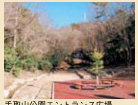
手取山公園エントランス広場