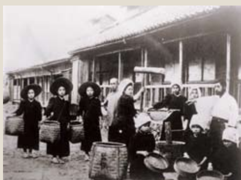
養蚕講習所女子受講生(明治43年)