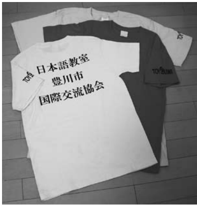
ボランティアユニフォームの例

交付対象団体 ①市の指定するロゴマークおよび団体名の表示されたユニフォーム等を取得する団体