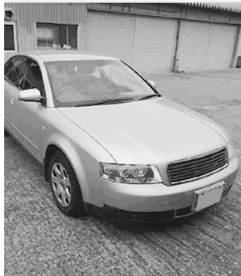
公売される自動車

市では、滞納処分として差し押さえた財産について、「ヤフー」の官公庁オークションを利用した公売を実施します。参加申し込みは、5月25日午後1時から6月11日午後11時までとなっています。参加を希望される方は、市ホームページ「豊川市インターネット公売のお知らせ」を閲覧の上、手続きをしてください。