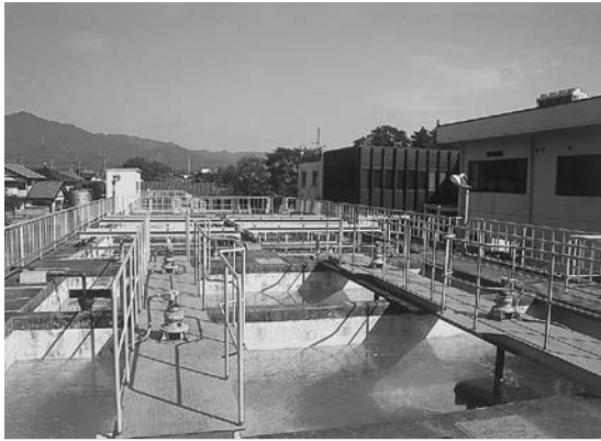
公開する市一宮浄水場