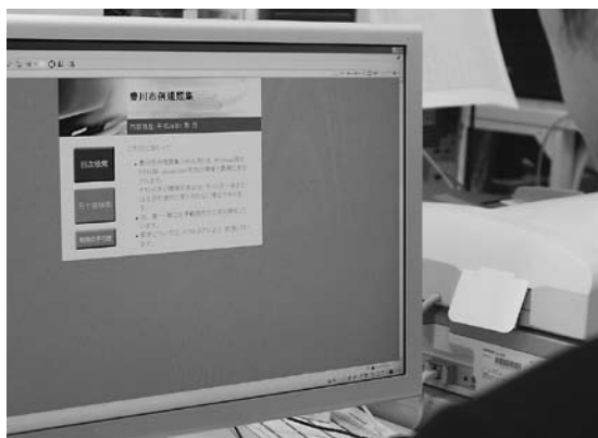
「豊川市例規類集」などがご覧になれます

覧（法令などにより閲覧などができる情報もあります）、訂正、利用停止することができます。訂正、明らかにするとともに、市が持つ個人情報に適正に取り扱うために必要な事項を定めて、皆さんの権利や利益を守るためのものです。