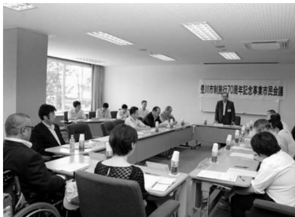
第1回豊川市制施行70周年記念事業市民会議