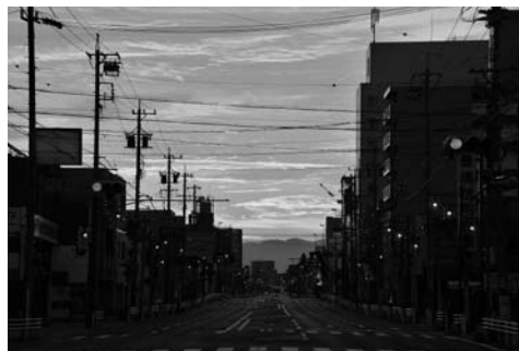
撮影場所:消防署前

暴力団排除に向けて、皆で協力しましょう。暴力団に関する相談は、0570-089347(やくざ用無し)へ。