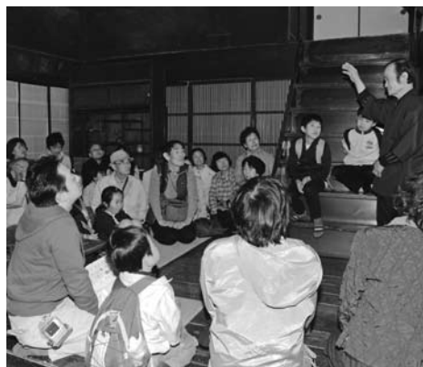
前回のとよかわ探検隊の様子

期日・上映作品 11月7日(水) Ⅱ「地獄門」衣笠貞之助監督、長谷川一夫ほか出演▼11月14日(水) Ⅱ「荒野の決闘」ジョン・フォード監督、ヘンリー・フォンダほか出演▼11月16日(金) Ⅱ「遠き落日」神山征二郎監督、三田佳子ほか出演▼ 時間 午前の部 10時から▼午後の部 1時30分から▼ 会場 ジオスペース館多目的ホール▼ 定員 各回100人▼ 会費 無料▼ 申し込み 当日、会場へ