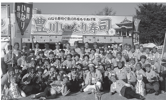
みなさまのご来場をお待ちしています