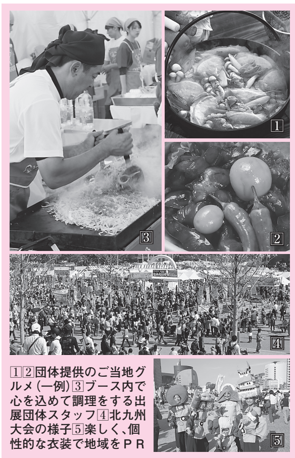
1 2 団体提供のご当地グルメ(一例) 3 ブース内で心を込めて調理をする出展団体スタッフ 4 北九州大会の様子 5 楽しく、個性的な衣装で地域をPR

B-1グランプリといえば、やはり箸による投票です。おいしい料理、楽しいパフォーマンス、おもてなしなど、気に入った出展団体に箸で投票をしてください。投票は一人一膳です。一本ずつ、二つの出展団体に投票することもできます。どの団体が「ゴールドグランプリ」に輝くのか、楽しみながら投票してください。