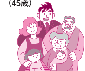
とよかわ健康づくり計画「健幸家族」

それから、ギターを弾ける人やボンゴをたたける人もメンバーに入り、今では「メキシカンサウンズいちのみや」と名乗り、年一回の発表会を開催しています。敬老会の他にも、依頼されてさまざまなイベントに出演するようになり、観客を楽しませることができるようグルーブになれたと思います。