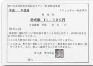
重度障害者用福祉タクシー料金助成利用券