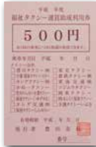
福祉タクシー運賃助成利用券

級かつ療育手帳A判定で、座位を保持することが困難で、ストレッチャーを使用しなければ外出することができない方 枚数 1人年間60枚(1枚1千円)