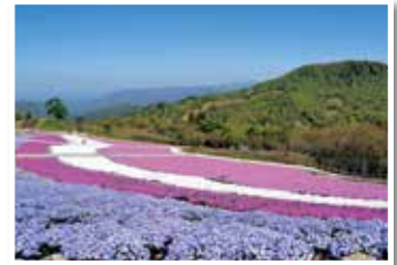
芝桜まつり(豊根村)