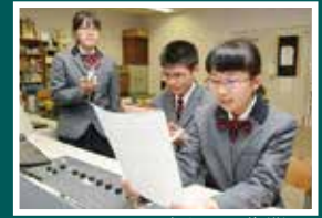
ナレーション吹き込み作業

小坂井高校・豊川高校放送部の皆さんに、投票参加を呼び掛けるナレーションの録音に協力してもらい、選挙期間中に広報車で使用しています。