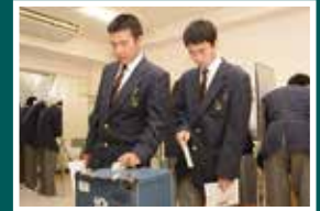
実際に選挙で使われる投票箱・記載台を使用した模擬投票

近い将来に有権者となる児童・生徒の皆さんに対して、選挙のたいせつさを知ってもらうことを目的に、学校で選挙講話や模擬投票などを行っています。