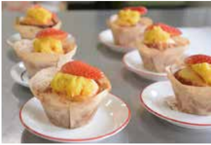
昨年の最優秀賞 「いなりカップマフィン」

(〒442-8601 諏訪1丁目1)へ。応募用紙は農務課(北庁舎2階)にあります(インターネットの「うまとうウェブ」からダウンロードできます) その他 書類による一次審査を通過した方は、2月24日(日)に、勤労福祉会館で試食審査があります。優秀作品に選ばれた方に、豊川産農産物の詰め合わせを贈呈します