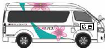
音羽地区地域路線 車体側面(運転手側)

申請 1月4日から31日まで。申込書に広告原稿案、会社概要、市税・国民健康保険料(税)滞納情報にかかる同意書などを添えて、直接、人権交通防犯課(北庁舎2階)へ。申込書などは、市ホームページからダウンロードできます