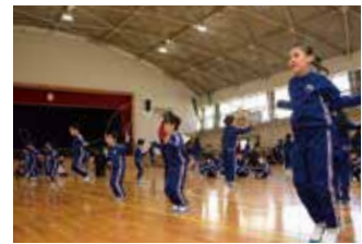
昨年の様子(千両小)

市では、市民の皆さんに子どもの様子や学校教育の実情を見ていただくことを目的に、「学校の日」を開催しています。第3回は、1月19日(土)に実施し、授業や創意工夫した活動を公開します。各学校の主な内容は下表のとおりです。どなたでも参加できます。