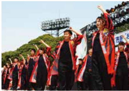
「おどら舞」コンテスト