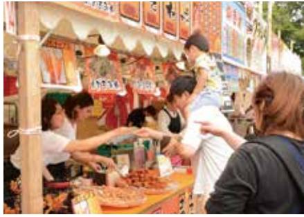
一般物販とグルメ

申込 4月2日(火)まで(必着)。はがきに①郵便番号・住所②氏名③電話番号④出店内容⑤希望日⑥ブース数を記入の上、豊川市民まつり協議会(〒442-18540豊川町辺通4-4豊川商工会議所内)へ