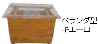
ベランダ型 キエーロ

申込 ▶ 領収書、申込書などをお持ちの上、直接、清掃事業課(北庁舎2階)へ。申込書は清掃事業課にあります(HPからダウンロード可)