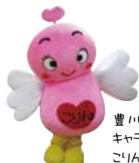
豊川市子育て支援キャラクター こりんちゃん