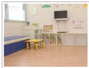
可知病院 病児・病後児保育室

その他 ▶ 利用日当日に診察が必要となります。また、医師の診断により、お預かりできない場合があります。なお、幼児教育・保育の無償化の対象となる場合は別途申請と認定が必要です