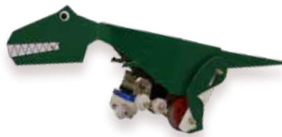
ティラノサウルスロボット