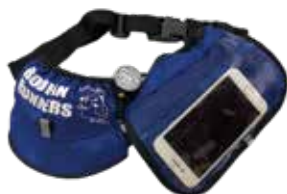
反射材付きウエストポーチとLEDライト