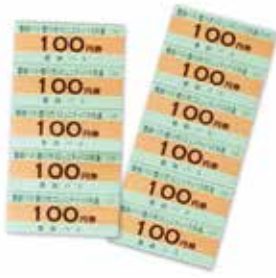
豊鉄バス・市コミュニティバス 共通回数券

センターへ。郵送での申込はできません。代理の方が申し込む場合は、署名した申込書と窓口に来られる方の身分証明書をお持ちください。申込書は各交付窓口にあります(市ホームページからダウンロード可) その他 共通回数券は、豊鉄バスの新豊線・豊川線と市コミュニティバス全線で利用できます。なお、交付予定の1千人分に達した時点で本年度の交付は終了となります。また、共通回数券の再交付はできません