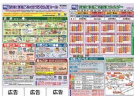
資源と家庭ごみ収集カレンダー

掲載期間 令和4年1月1日(土)から1月単位で最大12月 掲載場所 市ホームページのトップページ下側 掲載枠数 20枠 サイズ 縦60ピクセル×横150ピクセル 規格 GIFまたはJPEG形式の静止画で100KB以内 費用 1枠1万円/月 申込 10月18日(月)まで(必着)。申込書に広告原稿案、会社案内、市税・国民健康保険料(税)滞納情報にかかる同意書を添えて、直接、または郵送(〒442-8601 諏訪1丁目)で秘書課(本庁舎2階)へ