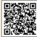
市ホームページはこちら

期間 ▶ 令和4年1月31日(月)まで 対象 ▶ 65歳以上の方と60～64歳で身体障害者手帳(心臓・腎臓・呼吸器・ヒト免疫不全ウイルスによる免疫機能障害)1級をお持ちの方 費用 ▶ 1500円(生活保護・市民税非課税世帯は無料) 申込 ▶ 対象者には、9月中に予診票を送付しています。希望する方は、予診票裏面に記載のある委託医療機関に直接、予約をしてください。委託医療機関は、市ホームページでも確認できます