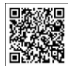
「ゆい」最新号はこちら