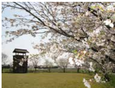
伊奈城跡(伊奈城趾公園)