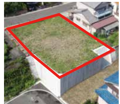
豊川駅東67街区9画地

その他 ▶ 宅地の予定価格や形状などは、区画整理課で配布している入札要領、またはHPで確認してください