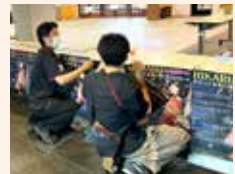
ロビーコンサート準備の様子

公演事業・ロビーコンサートの企画・運営や展示、ワークショップの受付などを行うボランティアスタッフを募集しています。詳しくは、文化会館、桜ヶ丘ミュージアムへお問い合わせください。