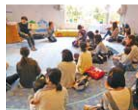
令和元年度の様子