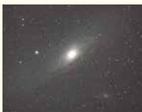
アンドロメダ銀河