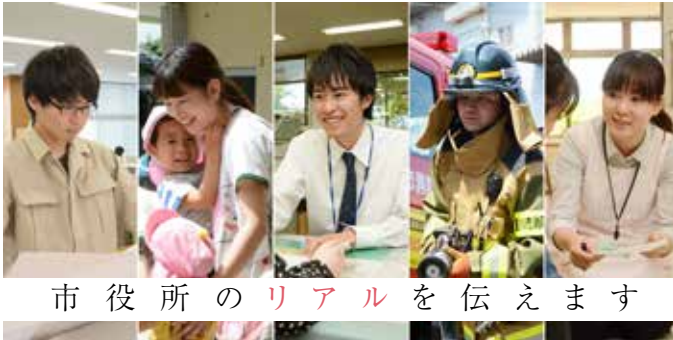
市役所のリアルを伝えます