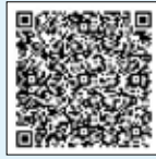
あいち電子申請 届出システム

11月1日8:30～ 30日17:15、あ いち電子申請届出シ ステムで受付。詳しい ことは、市ホームペ ージを確認してくだ さい。