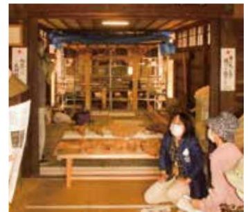
星野神社本殿は正面に柱が8本あり、各柱の間に1神ずつ祀られていたとされる七間社造。現在は1神だけ祀られている。

1641年に建立された星野神社本殿は、造りが全国でも珍しく、本殿を保護するために別の建物が覆うように建てられています。普段は外から見えませんが、今回の講座で地元の人たちに特別公開されました。参加者は「このような建物が現存しているとは知らなかった。地域の誇りとして大切にしたい」と郷土愛を深めていました。