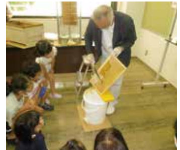
巣から蜜蓋をそぎ落とすと、中にはハチミツがいっぱい。ガムのような不思議な食感を味わいました。

親子10組24人が参加し、ミツバチの生態を学んだり、巣を遠心分離機にかけハチミツを絞り出したり、ハチミツの試食体験が行われたりしました。参加した子どもたちは、ミツバチと周りの環境との深いつながりを知ることができ、自然を守る大切さについて学ぶよい機会になりました。