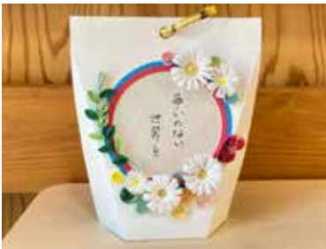
ペーパークイリング