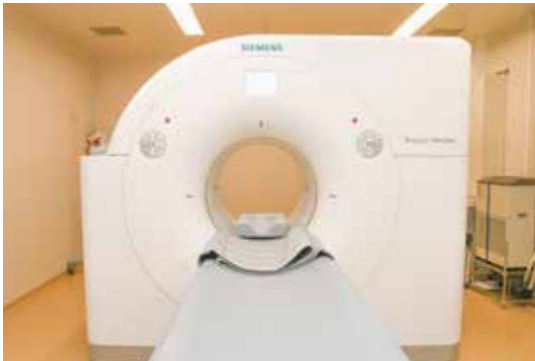
陽電子放射断層撮影装置

高い放射線量を扱うため、安全面に配慮し、過不足なく、患部だけを狙って治療を行っています。