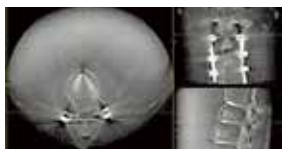
高精細な透視画像を手術中に映し出すことができます。

X線を用いて手術中に撮影できる画像システムです。最先端の移動式手術機器で、国内で90台が稼働しています。