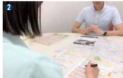
①緩和ケアでは、身体症状の緩和を担当する医師と心のケアを担当する医師、看護師、薬剤師、ソーシャルワーカーなどで情報共有し、支援方法を検討している②がん相談支援センターでは、がんに関する不安や疑問などについて相談を受け付けている