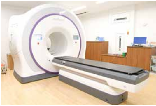
高精度放射線治療装置