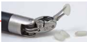
シャフトの先端に装着した医療器具を医師が操作して手術を行う。

腹部に開けた小さな穴から手術器具を取り付けた直径 8mm のシャフトと内視鏡を挿入し、拡大画像を見ながら操作して手術をします。拡大画像は立体的に表示され、緻密な操作が可能。傷が小さく、術後の回復が早いので、患者の負担を軽減できます。