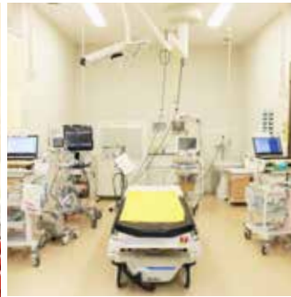
手術も行える設備を備え、24時間体制で高度な医療を提供している

一般の診療所が開いていない休日や夜間の三次救急に対応できる救命救急センターを令和元年12月に開設。生命の危機にひんしている患者に対して、高度な医療を24時間体制で提供しています。令和2年度は、約1万3千人の患者を診療しました。