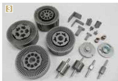
①人の目で不具合がないか一つ一つ検査を行う②小型化したプレス機を組み合わせると加工速度と生産性を上げる独自ライン③プレス加工によって製造された、自動車のモーターなどに使われる部品