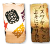
ペットボトル万灯

その他 ▶ 作品は、9月23日(金)に三河国分尼寺跡史跡公園で開催する「天平ロマンの夕べ」で展示します