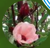
僕の作品が入賞しました！