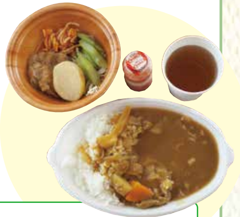
6月19日のメニュー カレーライス、サラダ、乳酸菌飲料

市の若者ボランティア「とよかわボラナビ」に登録して、初めての参加です。ボランティアに興味があり、自分の成長と地域の役に立ちたいという思いで始めました。時には、子どもたちとの接し方に難しさを感じるがありますが、勉強を教えたり一緒に遊んだりすることが楽しいです。今後も続けたいです。