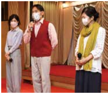
令和3年に砥鹿神社で行われた制作発表

豊川市出身で、とよかわ広報大使・渡辺いつけいさんの主演映画「マリッジカウンセラー」が、9月16日(金)から、豊川コロナシネマワールド他で、全国に先駆け公開されます。この映画は、昨年、豊川市をはじめ県内6市で撮影されました。市内の風景を、スクリーンでお楽しみください。 ロケ地 千両宝辺(千両町)、砥鹿神社(一宮町)、御油の松並木(御油町)他 出演者 渡辺いつけいさん、松本若菜さん、宮崎美子さん他 内容 結婚相談所を舞台に、恋愛や結婚をサポートする仲人たちの奮闘を描いた笑いや涙あふきの物語