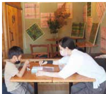
ボランティアによる ワークショップ