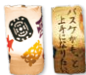
ペットボトル万灯

その他 ▶ 作品は、9月23日(金)に三河国分尼寺跡史跡公園で開催する「天平ロマンの夕べ」で展示します