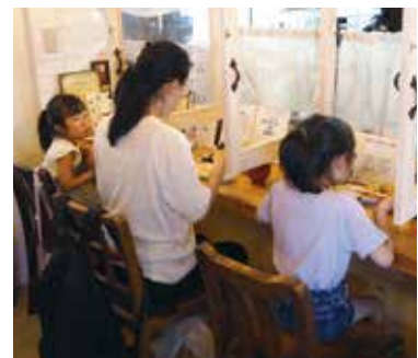
食堂はどなたでも 利用できます