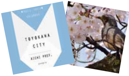
卓上カレンダーイメージ

6月22日から10月31日まで、掲載する写真を募集したところ、250点を超える応募がありました。一次審査を通過した写真の中から、皆さんの投票により、