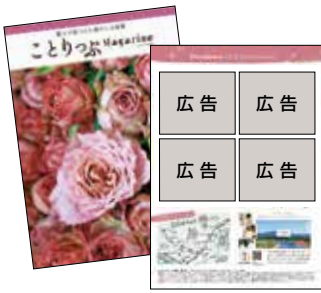
ことりっぴMagazineとよかわ

■ 豊川市観光ガイドマップ 掲載場所 豊川市観光ガイドマップ 掲載枚数 6枚 発行部数 2万部