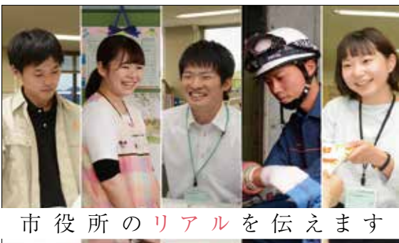
市役所のリアルを伝えます