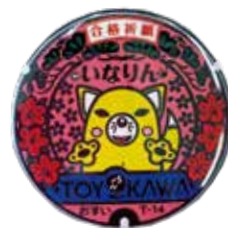
いなりんマンホール合格御守