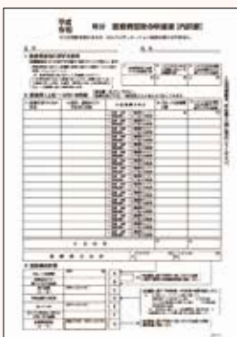
医療費控除の明細書