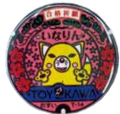
いなりんマンホール合格御守