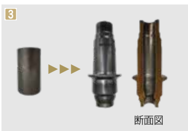
1 生産過程の課題などについて、金型製造部門と生産部門で話し合いを重ねる 2 常温の下、世界最大級といわれる1300トンの力を加えて鉄材を成形する設備 3 円柱形の鉄材(左)が独自製法により成形される(右)