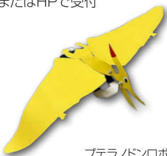
プテラノドンロボット

豊川市子どもセンター (生涯学習課内) ☎88-8035 日時▶ 10月21日(土)、11月25日(土)9:00~12:15 会場▶ プリオ生涯学習センター(プリオ4階) 内容▶ モーターで動くプテラノドンロボット作り 対象▶ 小学4~6年生 定員▶ 各回20人(先着順) 費用▶ 600円 申込▶ 10月13日(金)から、電話、またはHPで受付