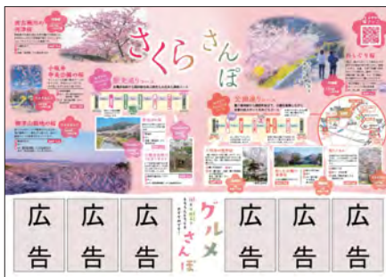
豊川市観光ガイドマップの広告

(必着)。申込書に広告原稿案、会社案内、市税・国民健康保険料(税)滞納情報にかかる同意書を添えて、直接、または郵送(〒442-8601諏訪1丁目1)で市街地整備課(北庁舎3階)へ その他 画像形式など詳しいことは、市ホームページを確認してください