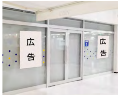
市催事場の壁面広告