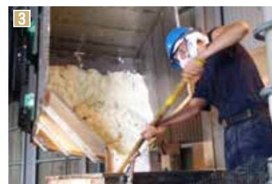
1 製造したエコフィードでブランド豚・雪乃醸を飼育 2 飼料化する食品は菓子や野菜など100種類にも上る 3 食品を粉砕して細かくしたり液体化したりすることでエコフィードに加工する