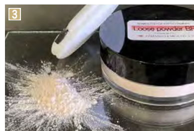
1 マイカパウダーの粒子分布などを画面で確認し、品質検査を行う 2 粉砕処理を行う前の、原料となる雲母 3 マイカパウダーにはさまざまな大きさや表面加工されたものがあり、化粧品用パウダーなどの材料となる