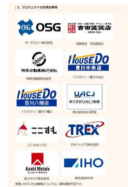
（企業ロゴ掲載イメージ）※画像は2018GCF#1（エアコン）