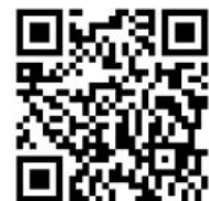
（ふるさとチョイス（GCFポニー）QRコード）

（連絡先）豊川市役所企画政策課 電話 0533-89-2126 kikaku@city.toyokawa.lg.jp