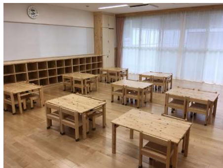
（事業1：公共建築物の木質化事業）