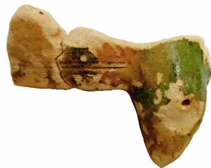
三河国分寺跡出土 奈良三彩陶器