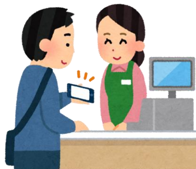
③お店でクーポンを利用