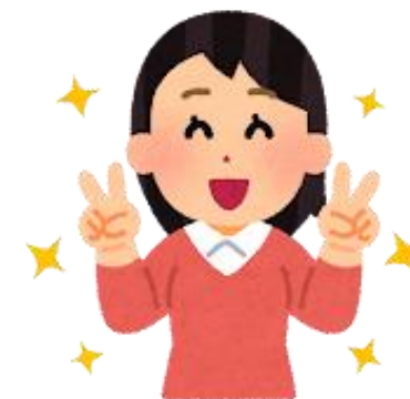
④300円引きでお店を利用