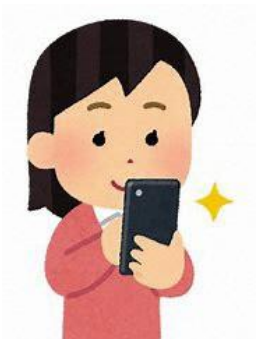
②店舗番号入力でクーポンを獲得