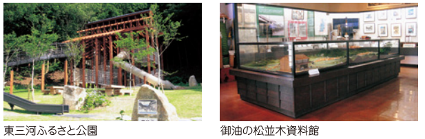
東三河ふるさと公園