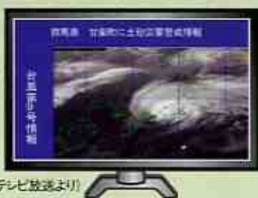
TVによる告知例（NHKテレビ放送より）

雨が降り出したら、土砂災害警戒情報に注意しましょう。土砂災害警戒情報は、気象庁ホームページや各都道府県の砂防課などのホームページで確認できます。都道府県や市長村によっては携帯電話等に自動的に土砂災害警戒情報を教えてくれるサービスもありますので活用してください。土砂災害警戒情報等が発表されていなくても、下記にある前兆現象のような異変を感じたらただちに避難するとともに、市町村役場や最寄りの都道府県土木事務所等へ連絡してください。