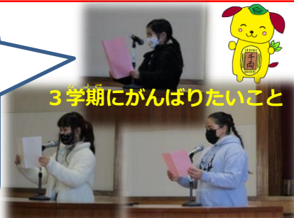
3学期にがんばりたいこと

「フェスティバルで大きな声で発表したいです」 「九九マスターになるよう頑張ります」「フェスティ バルで、大人も子どもも分かるような劇にしたいで す」「長なわをがんばって、やさしく教えてあげた いです」「リーダーとしてよい思い出を作りたいで す」「これまでお世話になった人たちに、心から 感謝の気持ちを伝えたいです」