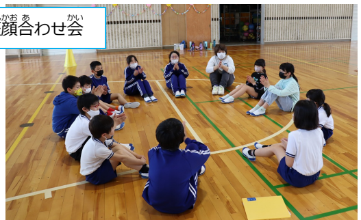
4/20 たてわり班顔合わせ会