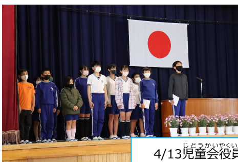
4/13児童会役員等任命式