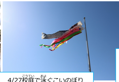
4/27校庭で泳ぐこいのぼり