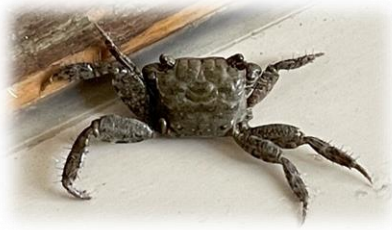
校舎の中でカニをよく見かけます