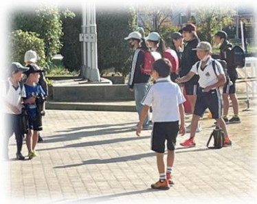
生活委員会によるあいさつ運動