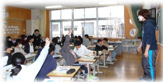
6年生が授業をがんばっていました。楽しそうに。